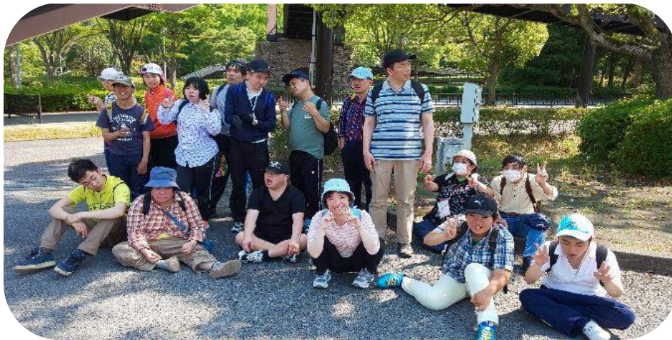
たくさん笑顔やピースサインが見れました。

きれいな景色が見えると噂の展望塔で集合写真を撮ろうと、みんなで一生懸命歩いたのですが、たどり着けずに残念でしたが、帰りのバスに乗り込む前に駐車場で集合写真!! 🙌